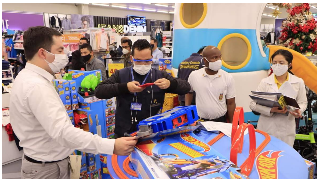
Reducirán muchas de las compras.

El freno en la obtención de bienes y servicios también tiene que ver con la maltrecha situación económica de la clase media. 84,3 por ciento de jefes de hogar de este eslabón poblacional dice que, en comparación con lo que sucedía en el 2019, ahora tienen menos posibilidades de comprar artículos como muebles, televisores y otros electrodomésticos.