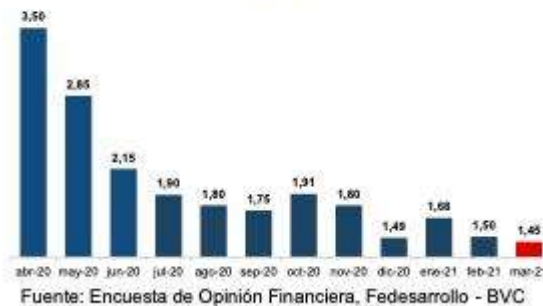
Gráfico 5. Pronóstico inflación – Marzo 2021

La inflación total para 2021 acabaría en el 2,63 %, frente al 2,58 % que se había informado en febrero.