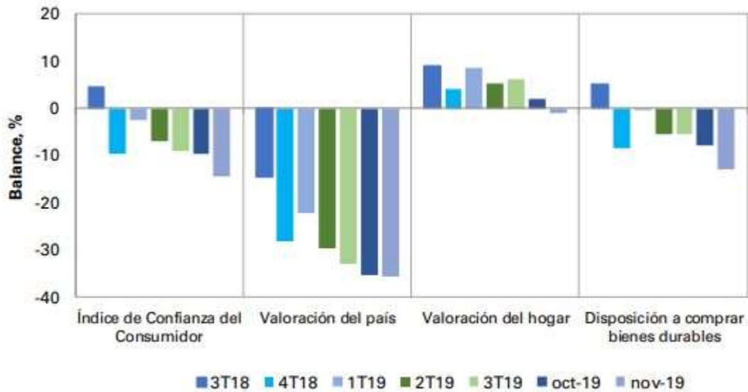
Gráfico 3. Percepción de los consumidores sobre situación del país y del hogar