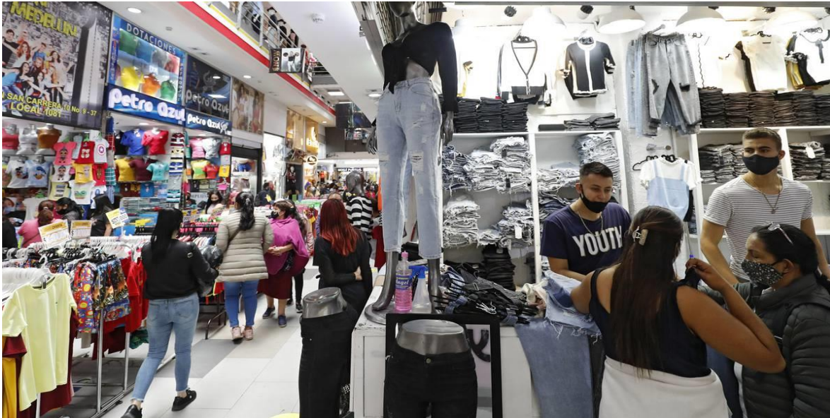
El Gran San Centro Comercial Bogota San Victorino madrugon comercio Nov 27 del 2020

Si se desagrega por sectores, la menor confianza se presentó en los sectores de construcción y comercio, que están viendo una pérdida en las mejores condiciones para sacar adelante sus negocios.