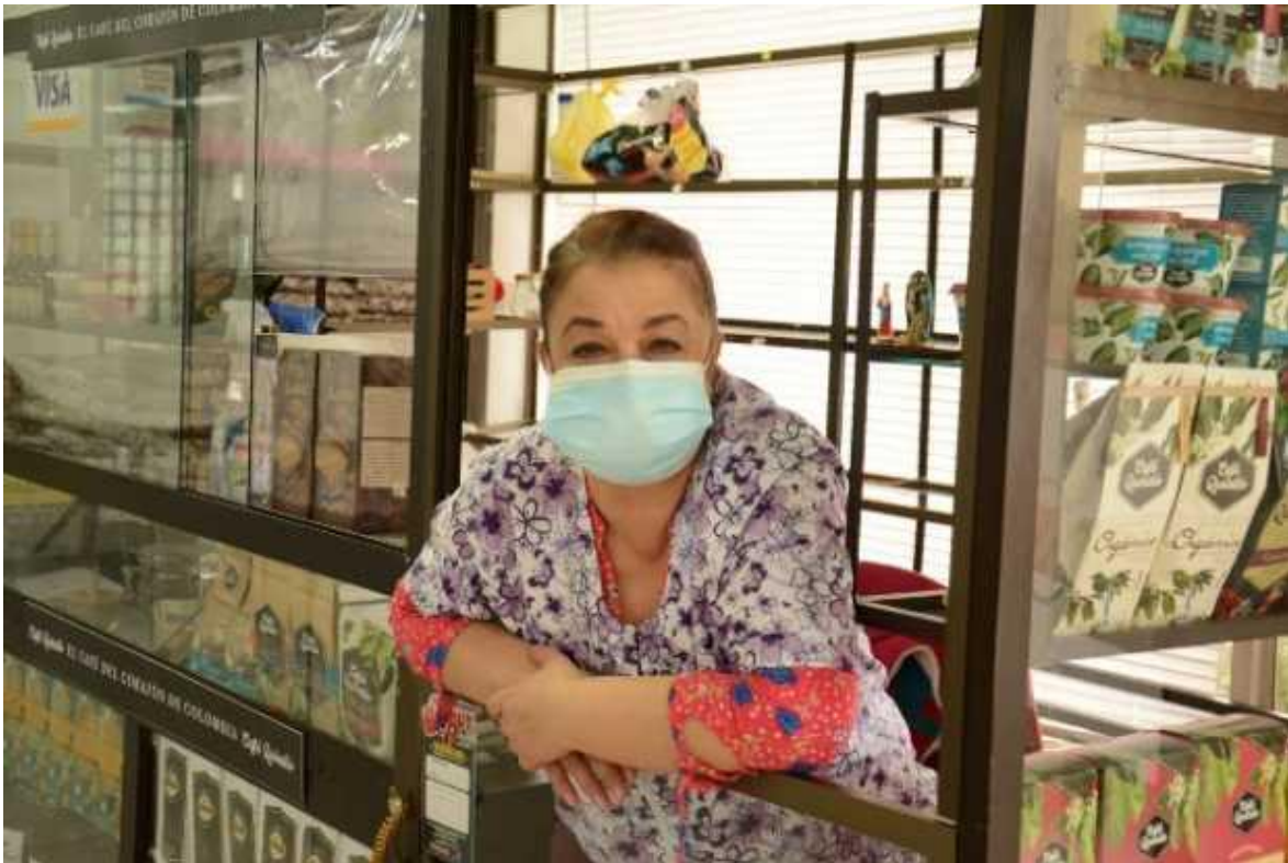
Las señales de la economía del país son incremento del desempleo, disminución del consumo de los hogares y aumento del indicador de pobreza.