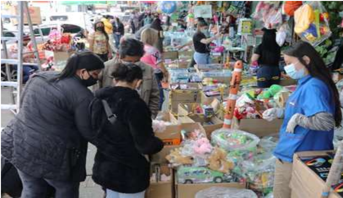
Ciudadanos hacen compras en el popular sector comercial de San Victorino en Bogotá (Colombia).

Este jueves, la Fundación para la Educación Superior y el Desarrollo (Fedesarrollo), reveló los resultados de su última Encuesta de Opinión Empresarial (EOE), en la cual se conoció que el Índice de Confianza Comercial durante el mes de febrero tuvo un aumento de 2.2 puntos porcentuales respecto al mes de enero, es decir que se ubicó en un 34,2%.