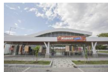
Colombina, entre las firmas más sostenibles del mundo por sex año consecutivo