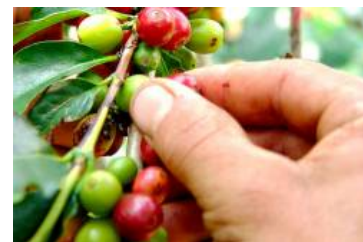
Federación de Cafeteros alerta al Gobierno por caída en el precio del café

Lo anterior ha causado un dramático deterioro de la producción nacional, poniendo en riesgo, no solo una parte significativa de los 288.000 empleos que genera la agroindustria de la caña, sino la estabilidad social y la ocupación lícita de tierras en el valle del río Cauca y en el Meta.