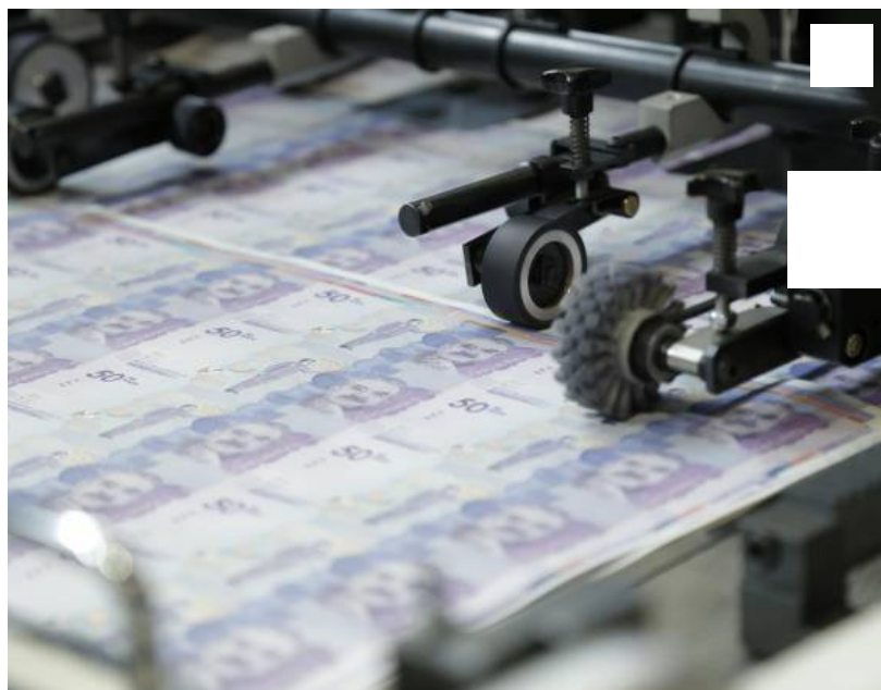
2,2 por ciento creció el PIB de Colombia en el primer trimestre del 2018.

Lea también: Colombina, entre las firmas más sostenibles del mundo por sexto año consecutivo