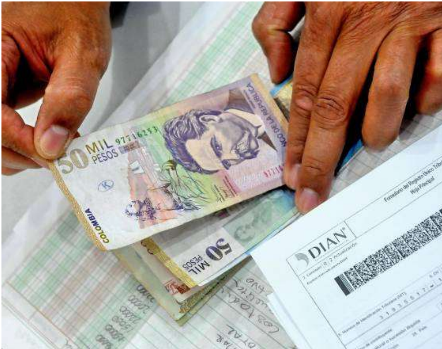
Imagen de referencia. La nueva reforma tributaria pretende ampliar los ingresos fiscales del país en $15 billones.

Marzo 16, 2021 - 11:50 p. m. Por: Redacción de El País