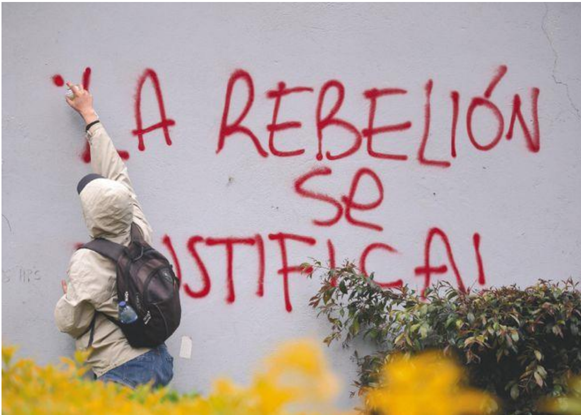
Paro Nacional - 21S

Las mayores concentraciones se esperan en Bogotá, en donde se encuentra la minga indígena. A casi un año del estallido social de noviembre de 2019, los reclamos siguen girando alrededor de los mismos polos, solo que con las presiones añadidas de la pandemia, que han inducido la que se anuncia como la peor crisis en la historia económica del país.