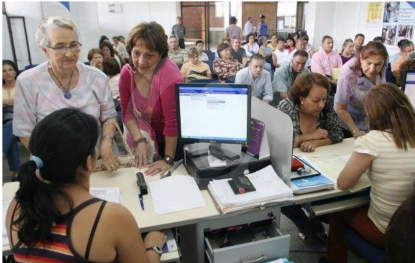
La academia asegura que el problema es tener un ingreso en la vejez adecuado o suficiente con respecto a la vida laboral.