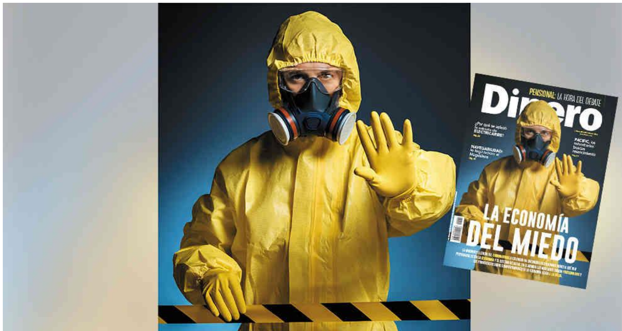
La economía entró en pánico por el coronavirus: ¿estamos preparados?