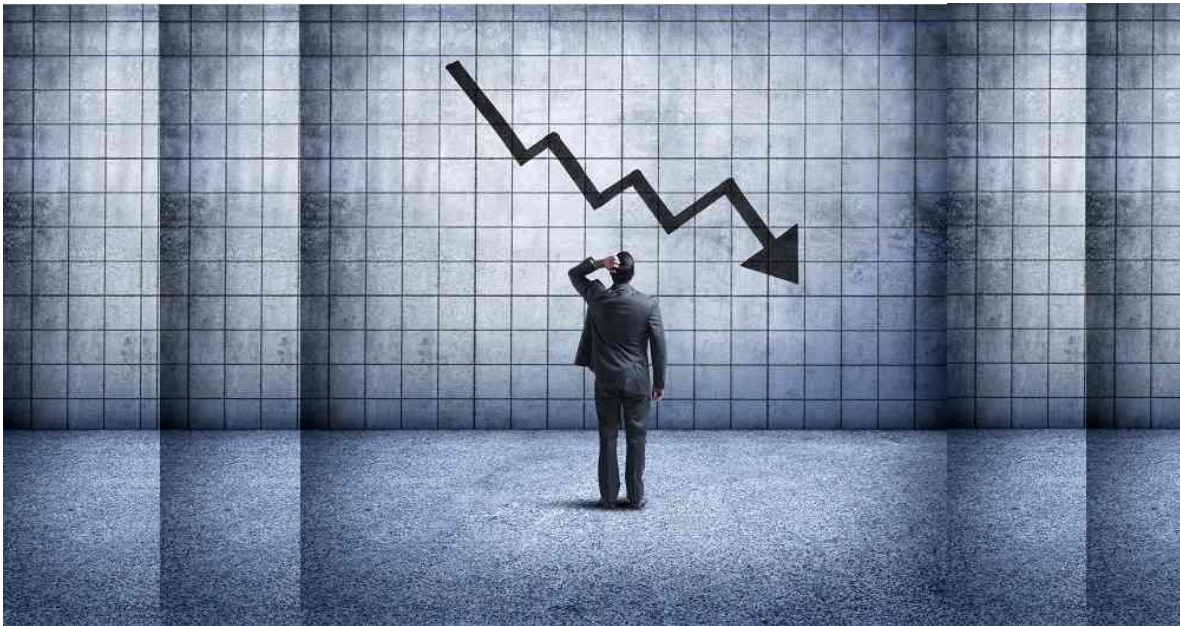
¿Entró Colombia en recesión económica?

La teoría económica dicta que si la actividad económica cae durante dos trimestres consecutivos, se puede hablar de una recesión, y con la caída del 9% en el PIB de Colombia para el tercer trimestre de 2020, el país completó dos trimestres consecutivos en terreno negativo.