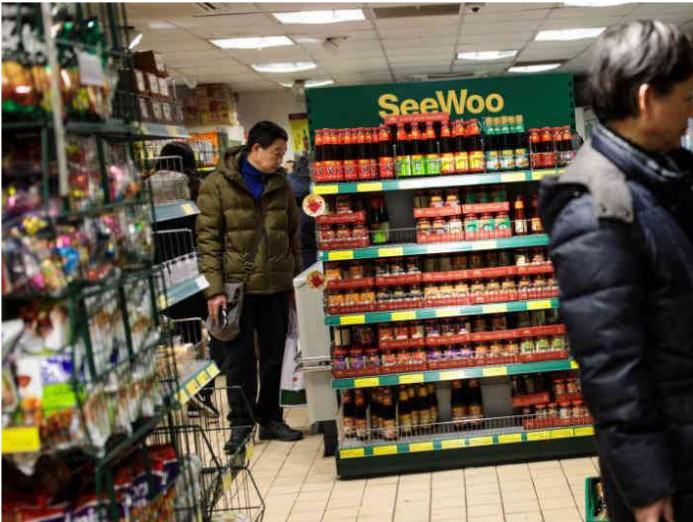
Confianza del consumidor positiva, pero insuficiente

El pasado jueves Fedesarrollo reveló el Índice de Confianza del Consumidor con su primer dato en terreno positivo desde 2015. Sin embargo, le falta camino por recorrer para volver a un nivel adecuado.