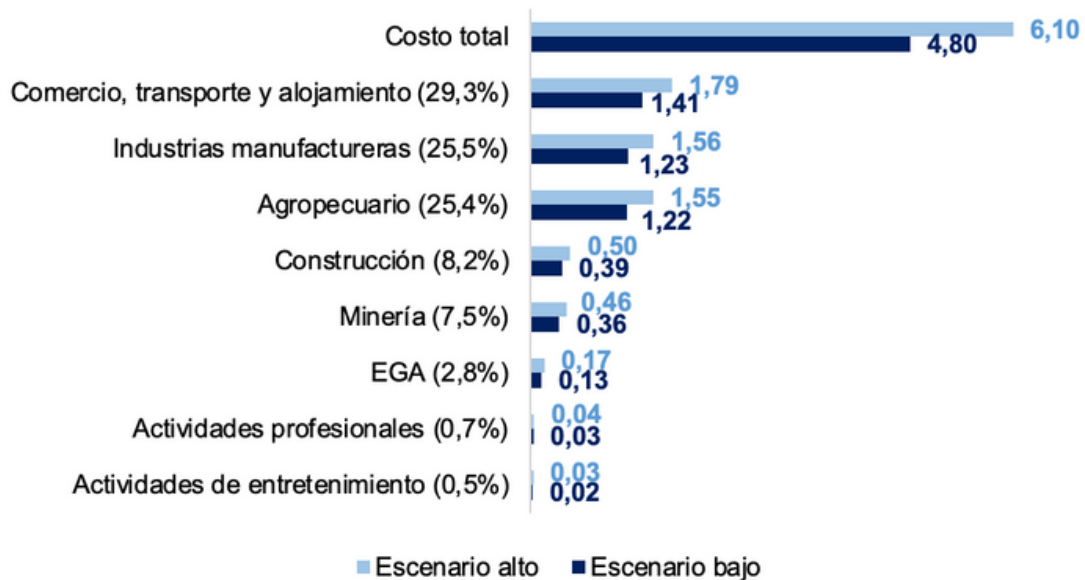
Gráfico 3. Costo económico por sector y participación del total (Billones de pesos)