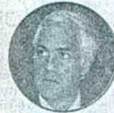
Samuel Moreno Exalcalde de Bogotá